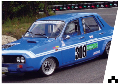
Adriano GRADI (Corpo Forestale) Vincitore della 1 a edizione del Challenge Velocità Polizie 2001