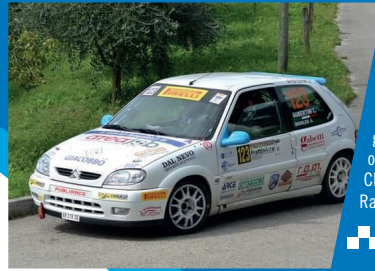
Claudio GUBERTINI (V.V.F. - MO) Andrea MUSOLESI (simpatizzante) 3° assoluto, 2° di gruppo N, 2° di classe oltre 1600 nel 30° Challenge Internazionale Rally Polizie - CIRP 2020