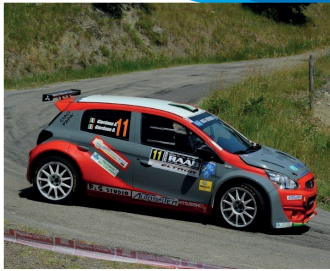
Davide GIORDANO (Polizia di Stato ©) Andrea GIORDANO (Simpatizzante) 5° assoluto, 2° di gruppo A-R, 3° di classe entro 1600, nel 30° Challenge Rally Polizie - CIRP 2020