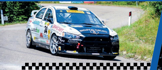
Pier Domenico FIORESE (Carabinieri ©) Francesco ZANNONI (Simpatizzante) 2° assoluto nel 20° CIRP, 1° di gruppo N. 1° nella speciale classifica IRCPIRELI riservata ai piloti dell'Acn Forze Polizia