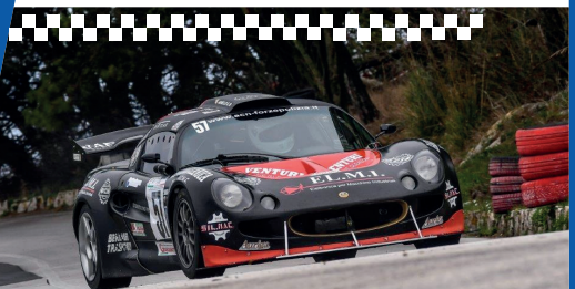
Giuseppe AGNELLO (Carabinieri) 2° assoluto e 2° di classe oltre 1600cc nel 20° Challenge Velocità Polizie-CVP 2020