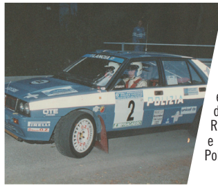
Valter VENTURI-Giorgio NARDIN Desiderio FANTIN-Gino SALMASO della Polizia di Stato - Vincitori ex aequo della 1 a edizione del Challenge Internazionale Rally Polizie e della 2 a edizione del Rally Polizie Europee